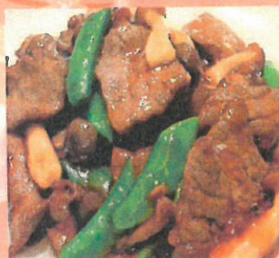
牛肉のカキソース炒め