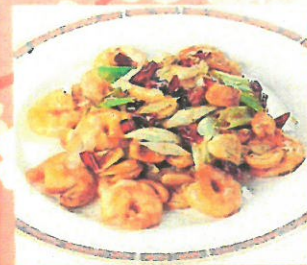
海老とカシューナッツの炒め