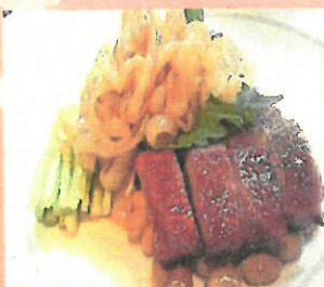
中華前菜盛り合わせ