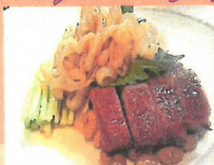
中華前菜三種盛り