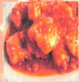
ソフトシュリンプの チリソース炒め

開催時間 17:00~20:30 (ラストオーダー) 早目のご予約お待ち申し上げます。