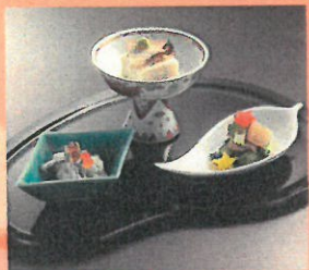
和食前菜三種盛り