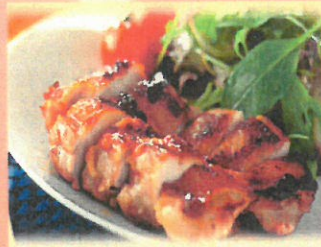
伊達鶏のチーズ照り焼き