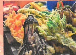
天婦羅盛り合わせ

開催時間 17:00～20:30(ラストオーダー)早目のご予約お待ち申し上げます。