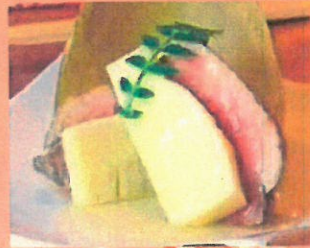
合鴨と筍の挟み焼き