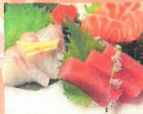
お造り三種盛り合わせ