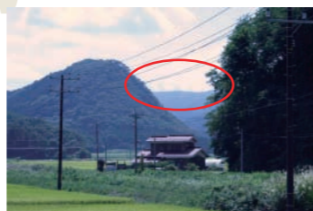
だんだん風車が姿をあらわします。